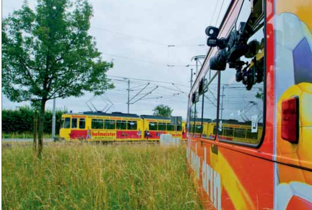
30. Juni 2007, Schleife Sonnenberg – neue Ansichten der Strecke garantiert. Solche Aufnahmen sind nur selten möglich, da das Lichttraumprofil dies nicht oft zulässt

Und nicht nur an der Strecke stellt Hellmuth die Apparate auf. Dem Fahrschul-GT4 Nummer 403 kommt die Ehre zu, als Sonderwagen Innen- und Fahrtaufnahmen zu liefern. Dafür installiert das Team eine Reihe von Kameras: hinter dem Fahrer, um diesem über die Schulter zu blicken, neben