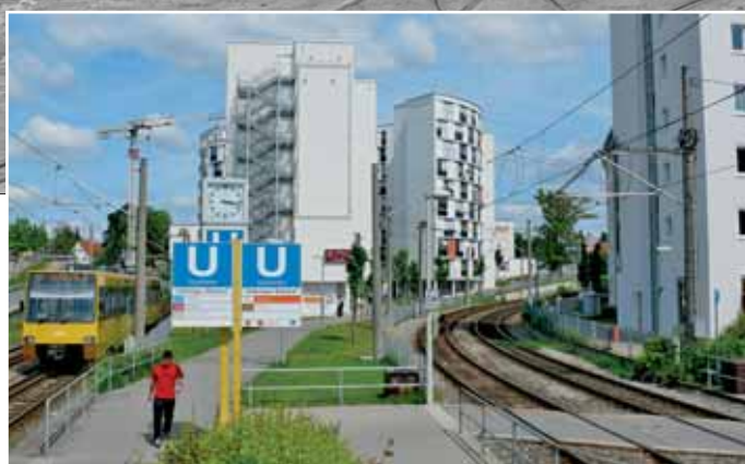
Die Filderbahnhalle einst und jetzt: Am 12. Juli 1969 warten die Wagen in dem Bauwerk auf den nächsten Einsatz. Rechts kommt ein 31er aus Plieningen und dahinter, Richtung Teigwarenfabrik, befindet sich die Kopfladerampe zum Verladen der GT4 auf normalspurige Wagen. 2009 sieht das Gelände ganz anders aus