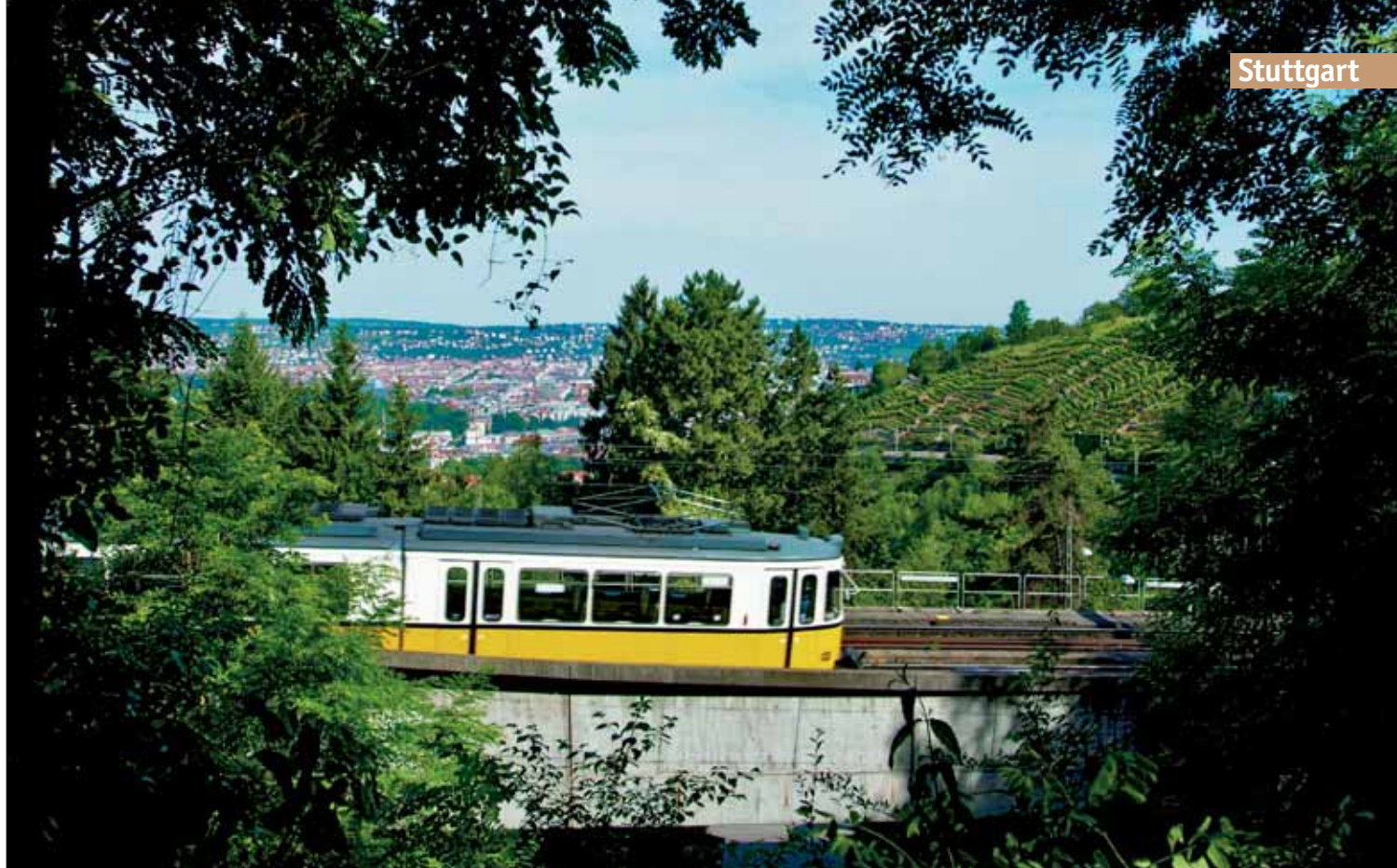
Ein GT4 auf der neuen Weinsteigelinie am 1. Juli 2007. Dahinter sieht man noch die frühere Streckenführung zwischen den Weinreben mit den alten Gittermasten für die Oberleitung, die bis heute stehen. Für diese Aufnahme nahm der Kameramann eine langwierige Kletterpartie auf sich – der Gelenktriebwagen rauschte dann innerhalb weniger Sekunden durch das Bild