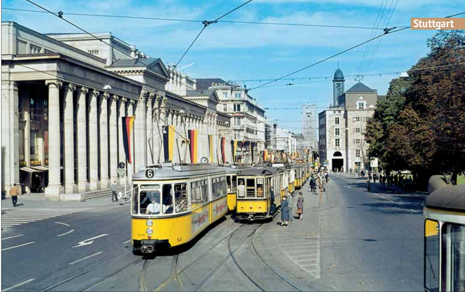
Buntes Treiben am 2. Oktober 1960 am Schlossplatz: Der auf der Linie 6 eingesetzte GT4 Nr. 548 ist genau zwei Monate alt, während nebenan noch Fahrzeuge aus den 1920er-Jahren Dienst verrichten. Auch hier zeigt die DVD den Vergleich zur aktuellen Situation

aus. Die Regenbilder erweisen sich als wenig geeignet – ein Nachdreh ist erforderlich. Hier kommt die SSB zu Hilfe. Am 13. August 2007 ist das Team auf dem SSB-Gelände in Möhringen, um Filmaufnahmen für den umfangreichen Werkstattbericht zu erstellen, der neben der Weinsteigefahrt der zweite Schwerpunkt des Films sein soll. Für den Nachmittag ergibt sich im Rahmen einer Fahrzeugüberführung von Bad Cannstatt nach Möhringen die Gelegenheit, die Szenen aus dem Fahrzeug auf dem Streckenabschnitt der Weinsteigelinie noch einmal aufzunehmen.