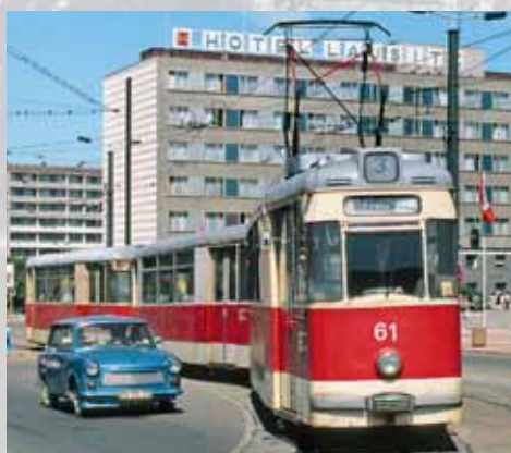
Geschichte und Zukunft: 110 Jahre Tram in Cottbus