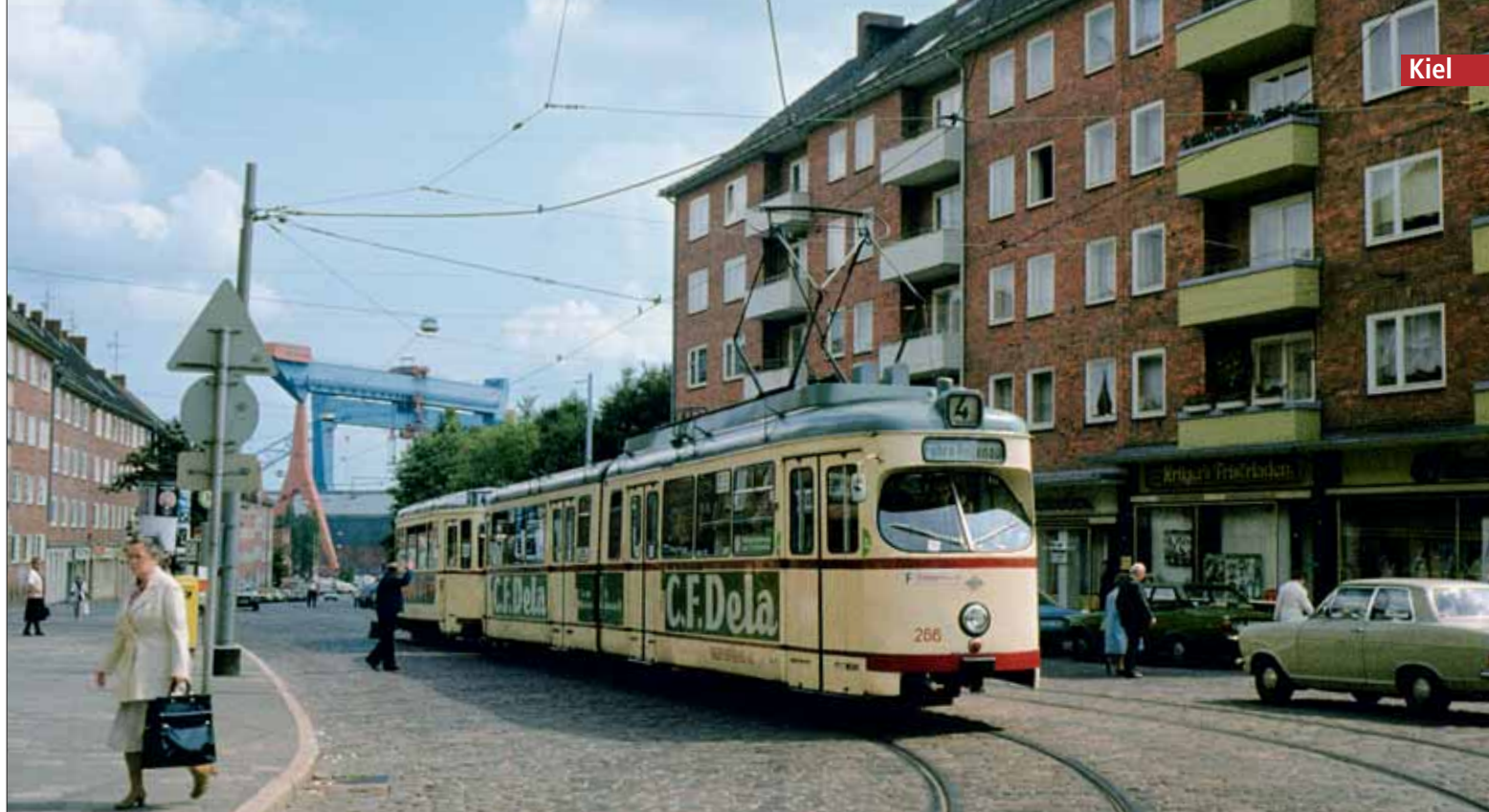
Seit 1951 fuhr die SL 4 über die neue Wertstraße in die Elisabethstraße. Gleich ging es für den Fahrer des Düwag-Gelenktriebwagens 266 am 11. Juni 1981 in das eingleisige Streckenstück in der Kieler Augustenstraße