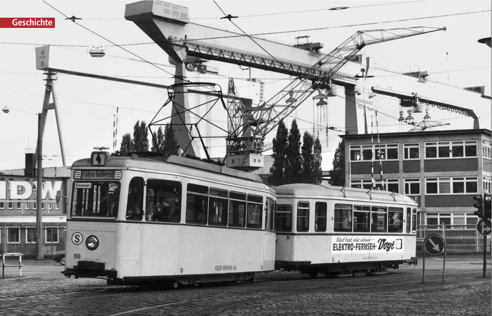
Die mächtigen Kräne der Howaldtswerke Kiel sind für den Zweiachserzug auf der Linie 4 eine beeindruckende Kulisse