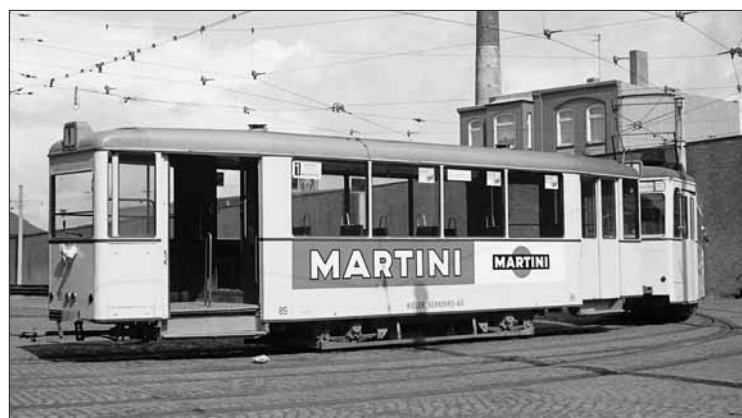
Nach der Einstellung der SL 3 im Jahr 1965 ging man in der Werkstatt in Gaarden daran, die 1960 aus Lübeck übernommenen Motorwagen (Aufbautyp) zu Beiwagen umzubauen, hier Bw 85 im August 1965