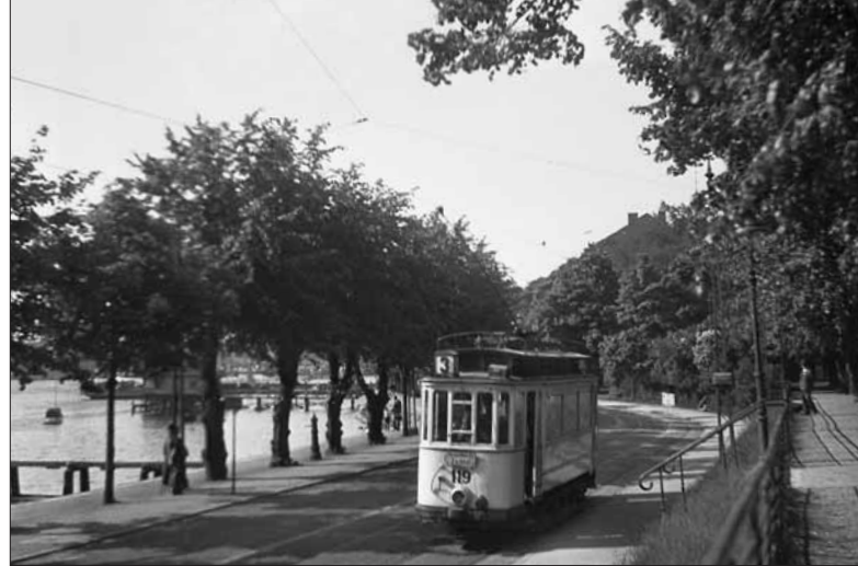
Im Jahr 1937 ist der 1900 gebaute Triebwagen 119 vom Niemansweg kommend auf dem Weg in die Innenstadt und weiter zum Eichhof