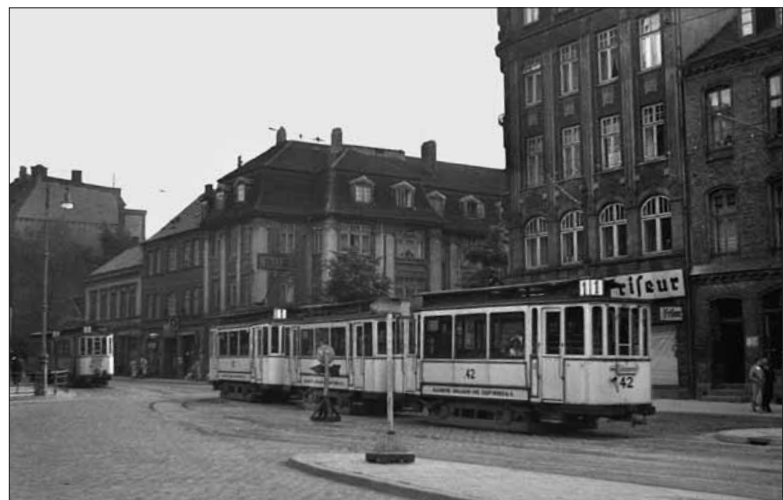
Von Otto John stammt dieser Nachschuss aus dem Jahre 1937 auf einen Dreiwagenzug in der Holstenstraße. Trieb- und Beiwagen sind zu diesem Zeitpunkt vollverglast