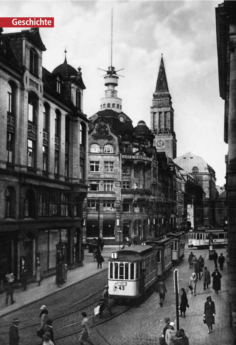
Blickte man von der Holstenstraße in Richtung Rathausurm, so pasierte Anfang der 1930er-Jahre die Kieler Straßenbahn in dichten Abständen die Fleethörn