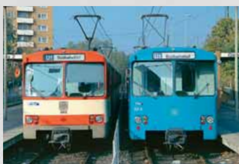
Das Ende nach 45 Jahren: Typ U2 in Frankfurt am Main