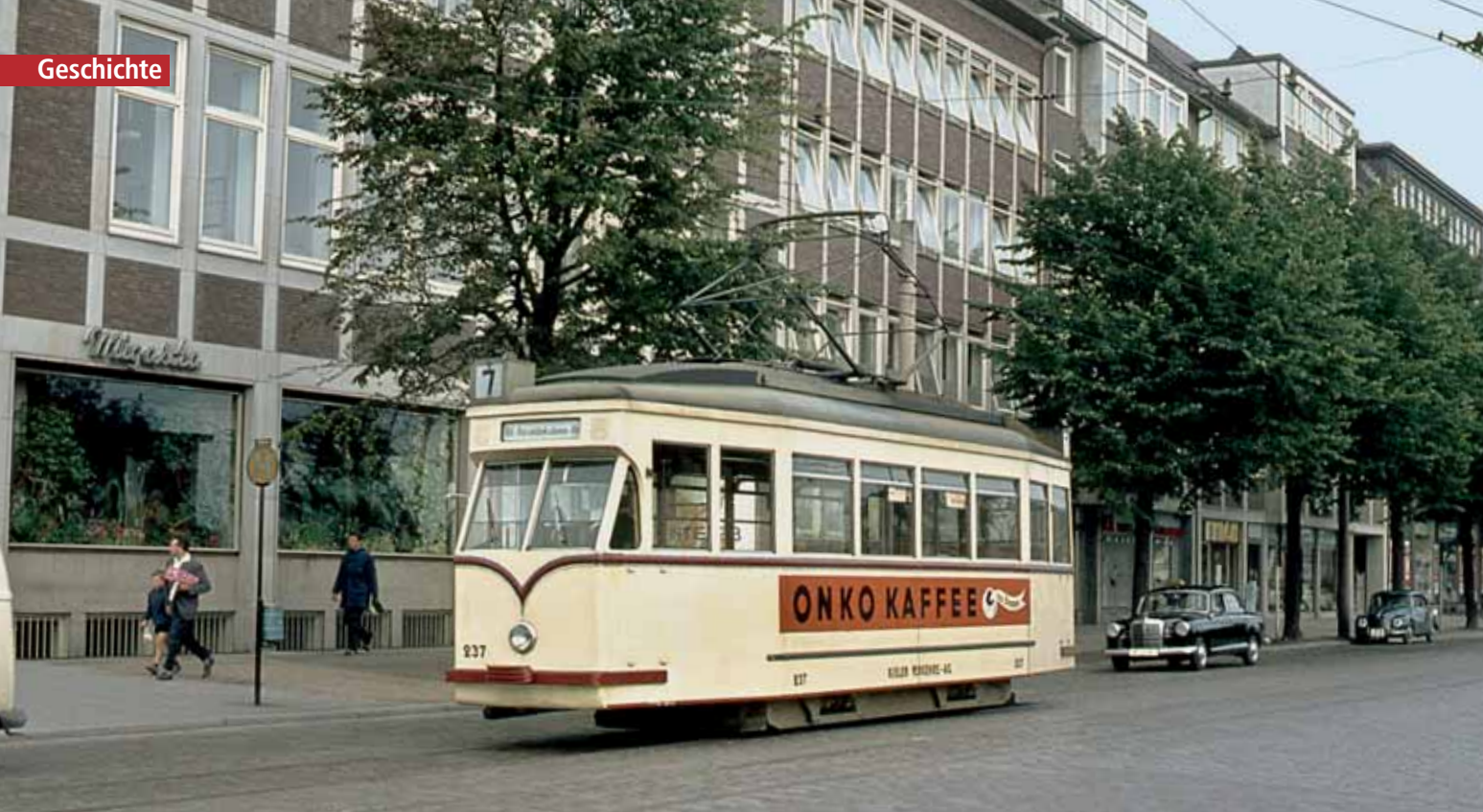
Am 11. August 1962 nahm Wolfgang Kramer den Triebwagen 237 an der Auguste-Viktoria-Straße/Hbf auf. Er gehört zu den sieben zwischen 1953 und 1956 in der eigenen Werkstatt der KVAG gebauten Einrichtungswagen (Tw 231 bis 237)