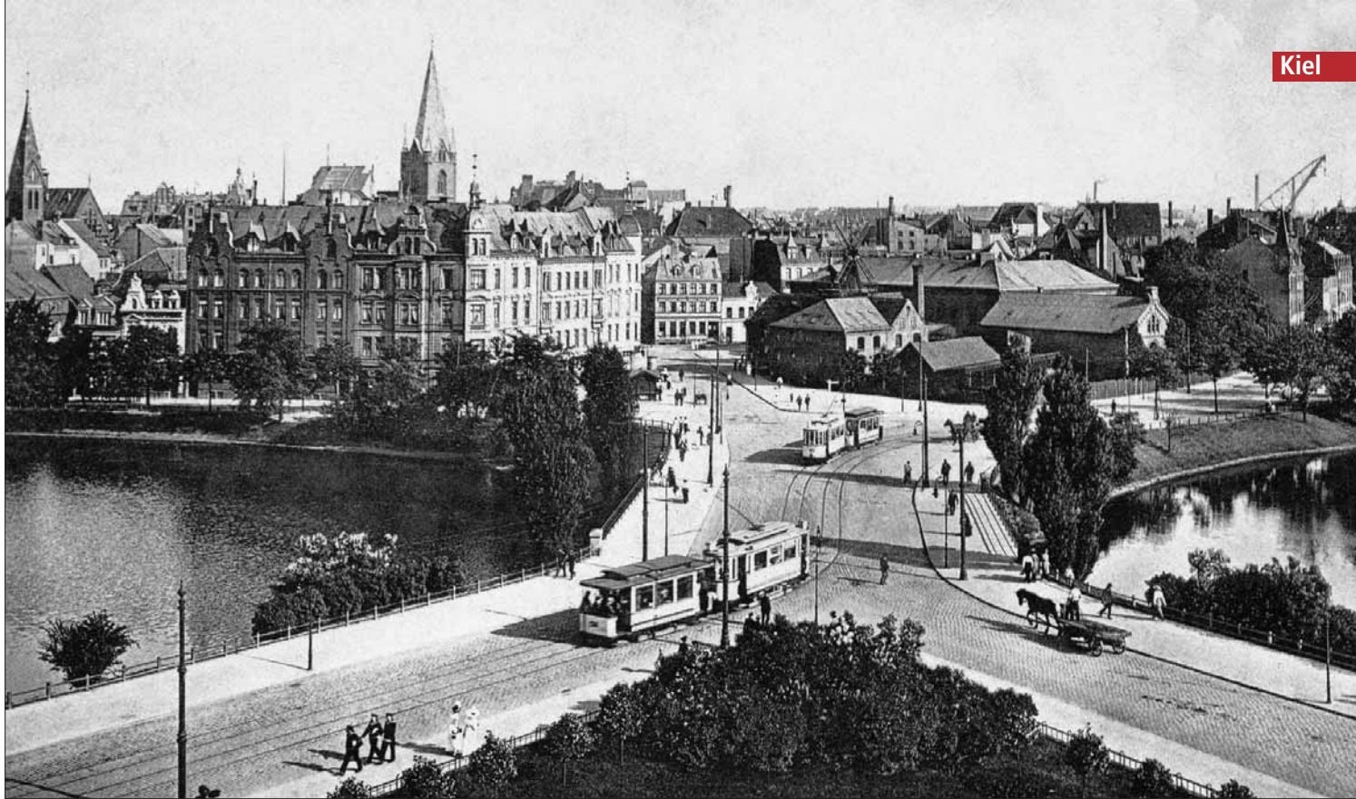
Der Fotograf dieser Ansichtskarte hielt beim Blick auf den Kleinen Kiel in Richtung Förde zwei noch vor dem Ersten Weltkrieg gebaute Triebwagen im Bild fest