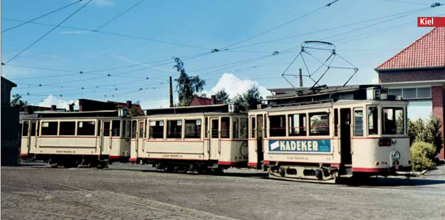
Nur fünf Monate nach der am 6. Juli 1965 im Betriebshof Wik entstandenen Aufnahme musterte die KVAG den 1919 gebauten Triebwagen 174 im Januar 1966 aus. Die vor dem Ersten Weltkrieg gebauten Beiwagen 15 und 36 folgten im Laufe des Jahres