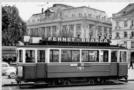
Sie wurde nur 68 Jahre alt: Fribourgs Tram im Porträt