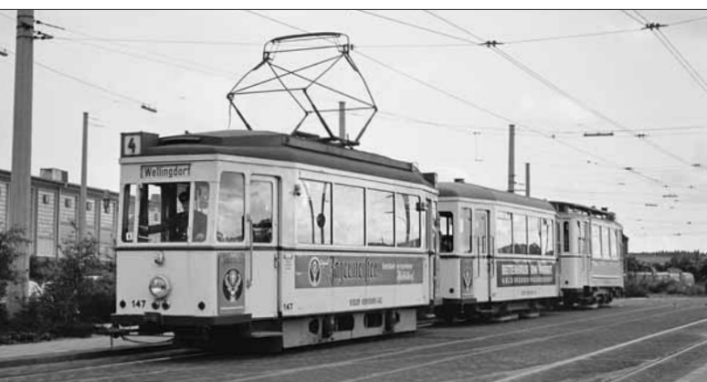
Tw 147 entstand 1950 unter Verwendung von „Altteilen“ als Neufahrzeug. Die Deklaration als Umbauwagen brachte dem Betrieb Fördermittel aus dem „European Recovery Program“ ein