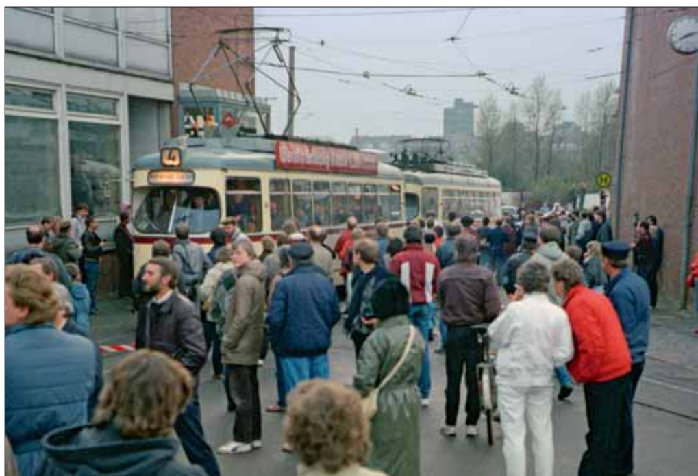
In der letzten Stunde vor dem „Aus“ verabschieden die Kieler ihre Straßenbahn auf der Einfahrt zum Betriebsgelände. Dann gibt es kein Zurück mehr – der Strom auf der Strecke wird nach Einrücken des letzten Fahrzeugs sofort abgeschaltet

Kreipe, Helmut (Hrsg.): Erinnerungen an die Kieler Straßenbahn, Broschüre, Kiel 1985 eigene Aufzeichnungen des Autors